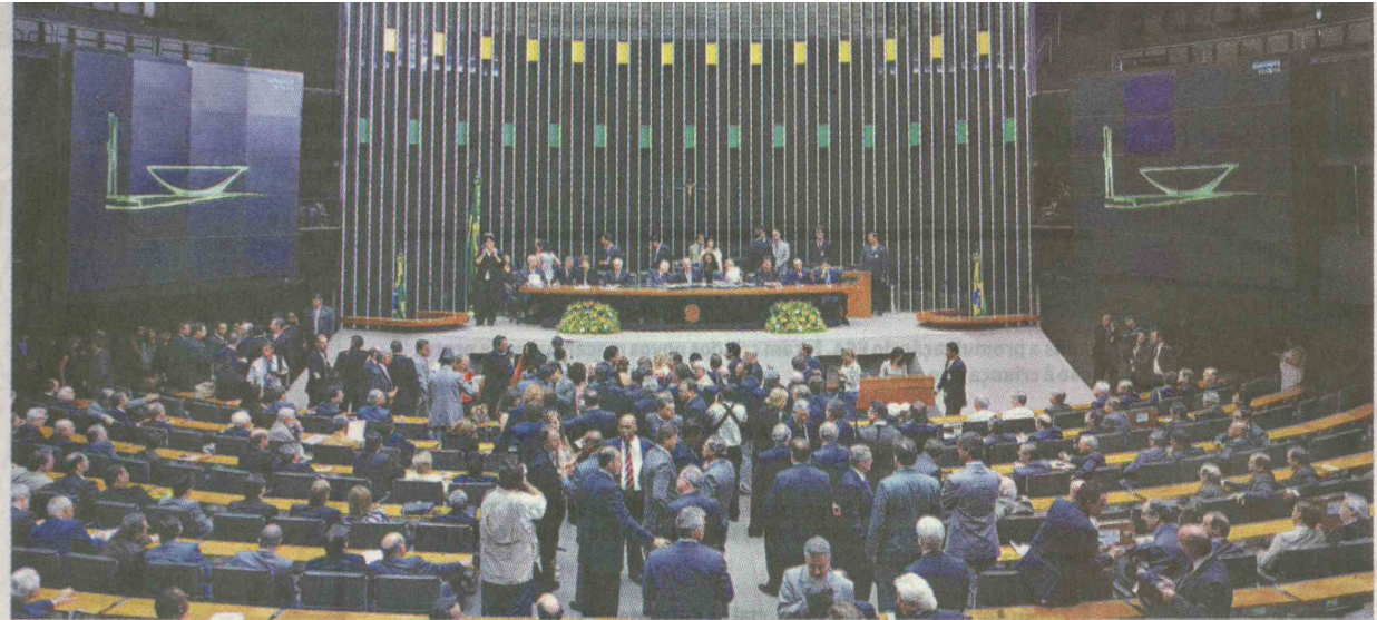
O número de postulante à Câmara Federal pode mudar. É que o Tribunal Superior Eleitoral (TSE) está atualizando os dados dos candidatos